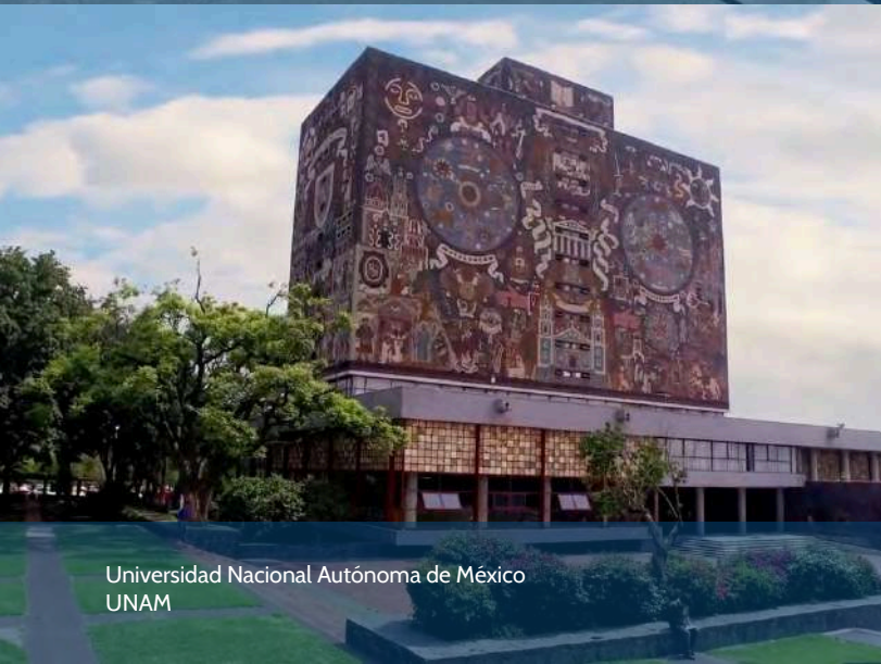
Universidad Nacional Autónoma de México UNAM