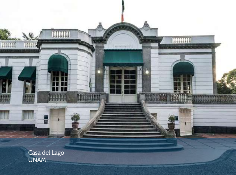
Casa del Lago UNAM